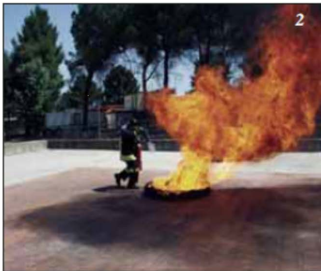
Foto 2 Si dirige sul fuoco sopravvento, come si evince dalla direzione delle fiamme ed aziona l'estintore.

Foto 3 Sparge in modo circolare il gas sul focolare eliminando la possibilità per il combustibile di ossigenarsi, quindi ottiene l'estinzione.