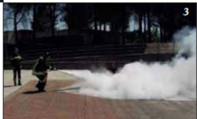
Foto 3 Si dirige sul fuoco spargendo la polvere alla base delle fiamme a ventaglio, al fine di coprire l'intera superficie interessata.

Foto 2 Inizia l'erogazione dell'estinguente posizionandosi sopravvento.