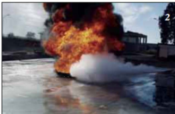
Foto 2 Inizia l'erogazione dell'estinguente posizionandosi sopravvento.

Foto 3 Si dirige sul fuoco spargendo la polvere alla base delle fiamme a ventaglio, al fine di coprire l'intera superficie interessata.