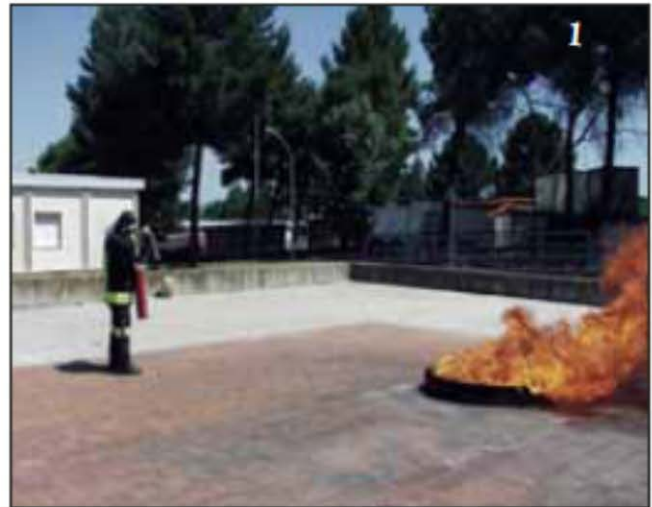
Foto 1 L'operatore impugna l'estintore e si prepara all'attacco del fuoco.