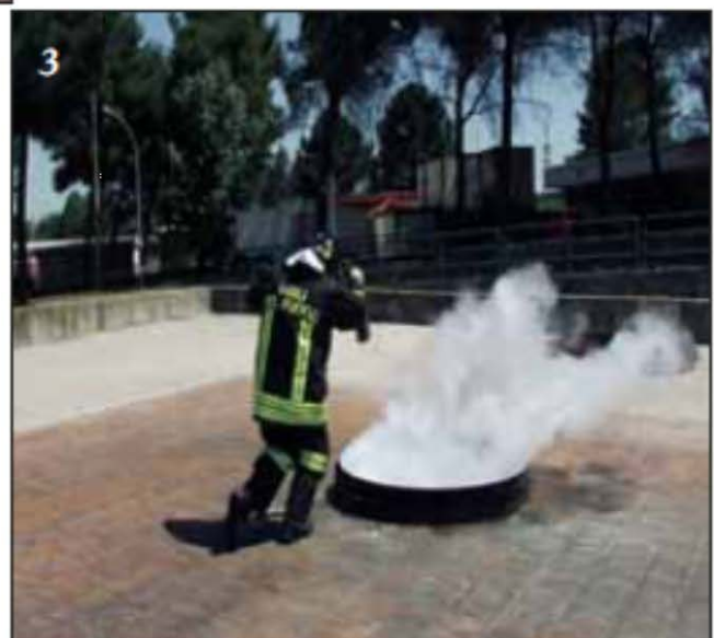
Foto 3 Sparge in modo circolare il gas sul focolare eliminando la possibilità per il combustibile di ossigenarsi, quindi ottiene l'estinzione.

Foto 2 Si dirige sul fuoco sopravvento, come si evince dalla direzione delle fiamme ed aziona l'estintore.