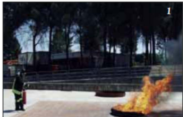
Foto 1 L'operatore è pronto per attaccare il fuoco con un estintore a polvere.