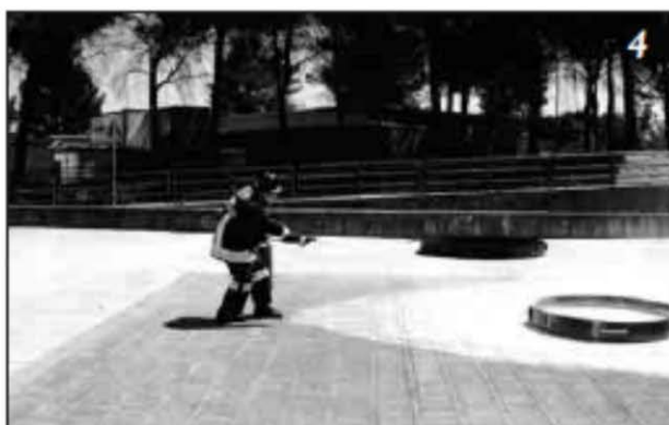
Foto 4 Focolare estinto. Si nota la traccia a forma conica lasciata dall'effetto ventaglio operato nella fase di estinzione.